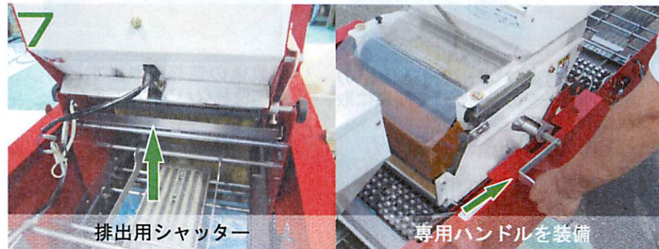
排出用シャッター