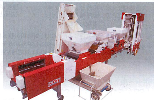
※ミニコン、施肥ホッパー、積上機は、別売りです。